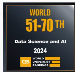
数据科学与人工智能 51-70