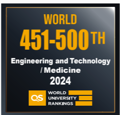
工程与技术 / 医学 451-500

*Rankings applicable to Taylor's University