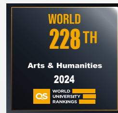
艺术 & 人文 228