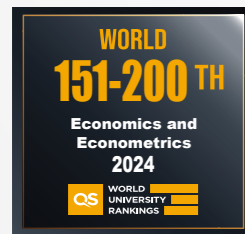
经济学与计量经济学 151-200