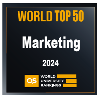
市场营销 TOP 50