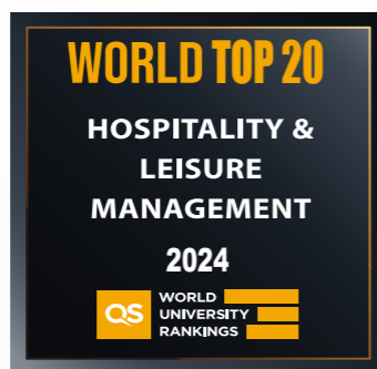
酒店与休闲管理 TOP 20