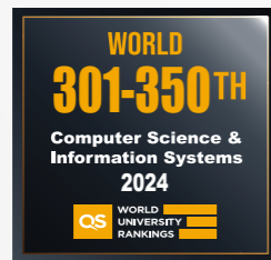
计算机科学与信息系统 301-350